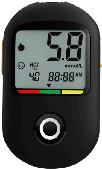
Glukometr SEJOY BG-710b

Rozsah měření 0,6–33,3 mmol/L je vhodný pro běžné sledování hodnot glukózy.