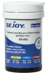
Testovací proužky BS-602 50ks v 1 balení